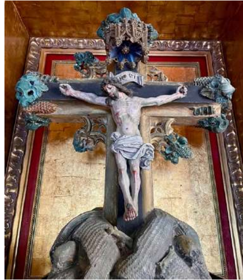
Anónimo Cristo de la Luz Primera mitad S. XVI Ermita del Cristo de la Luz, Ávila

El conjunto se representa igualmente con la Virgen y San Juan, algo que se generalizará ya durante el siglo XVI, donde convergerán los influjos tardogóticos de inspiración flamenca con las nuevas ideas renacentistas. En la pintura, proliferarán las tablas de temática religiosa. En el ámbito escultórico, se