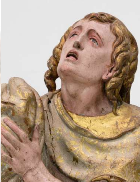
Pedro de Salamanca San Juan 1544 Catedral del Salvador, Ávila