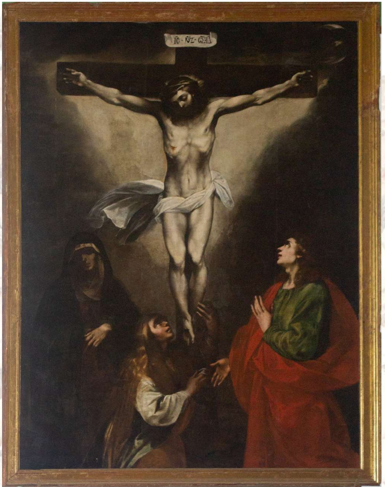
Escuela Sevillana Calvario S. XVII Iglesia de San Ignacio de Loyola, Ávila