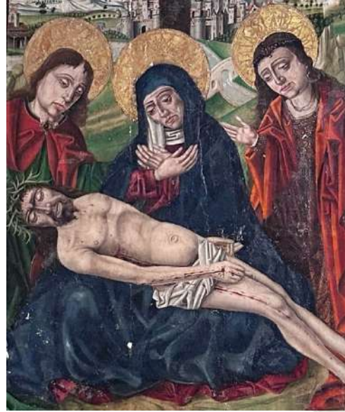
Taller hispanoflamenco Piedad S. XV Ermita de Nuestra Señora de la Cabeza, Ávila