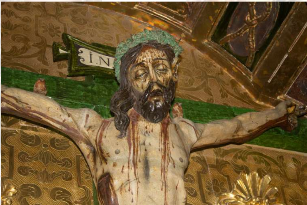
Escuela de Ávila Cristo de la Piedad h. 1550 Iglesia de San Ciprián, Fontiveros

Por último, reforzar la idea de hermandad que persigue la Junta de Cofradías de Semana Santa al reunir en un solo espacio, no solo bienes procedentes de las hermandades que la componen, sino también de gran parte de las instituciones abulenses.