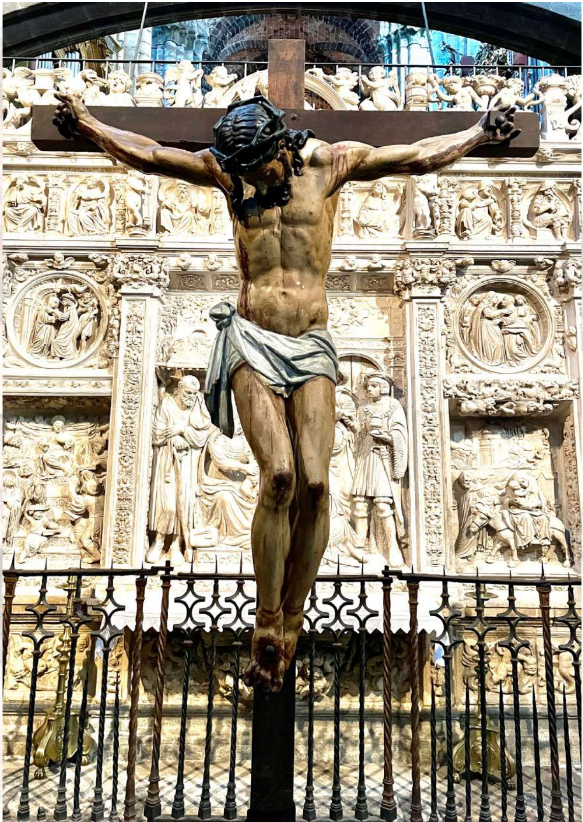
Juan Vela (atrib.) Cristo de Anaya h. 1576 Catedral del Salvador, Ávila