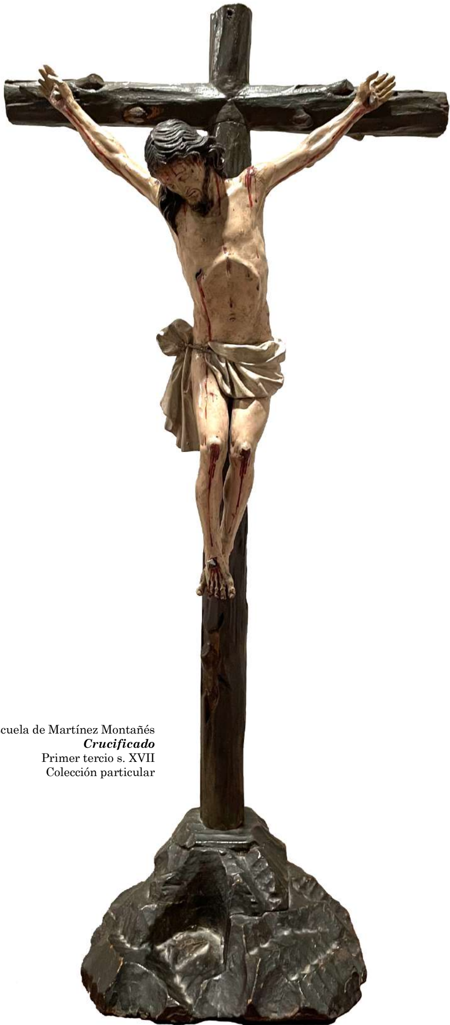
Escuela de Martínez Montañés Crucificado Primer tercio s. XVII Colección particular